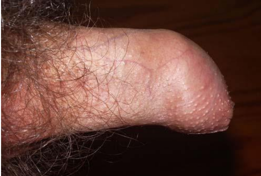
Hình ảnh về hẹp bao quy đầu ở người lớn

Hẹp bao quy đầu có hai mức độ bao gồm hẹp bao quy đầu hoàn toàn và bán hẹp bao quy đầu.