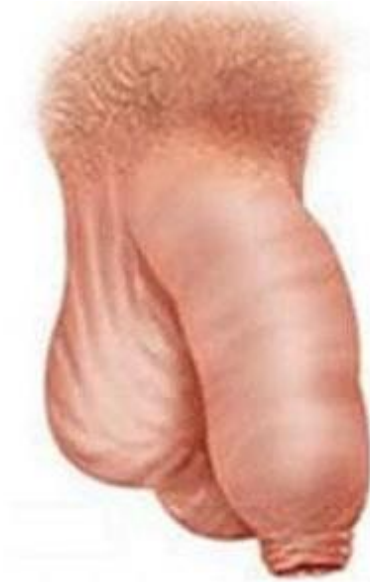
Hẹp bao quy đầu ở người lớn