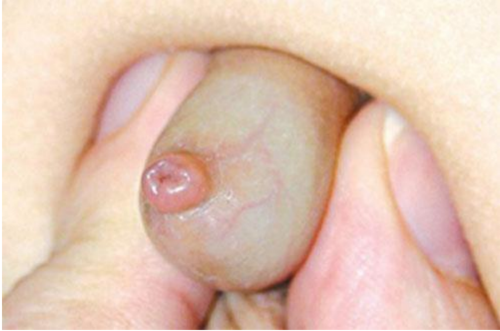
Hình ảnh hẹp bao quy đầu ở trẻ sơ sinh