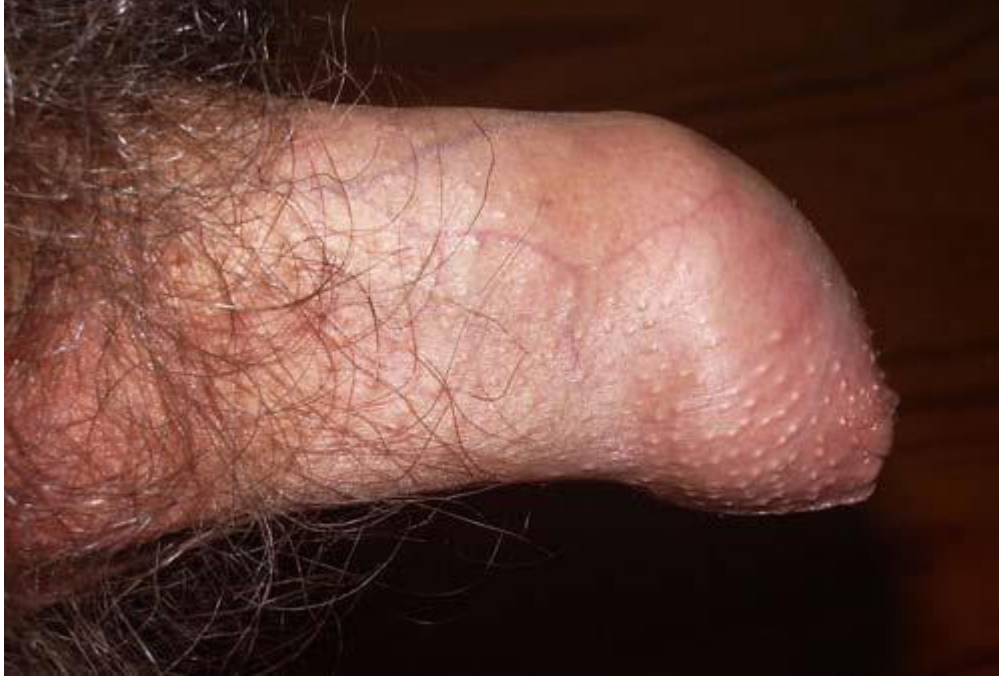
Hình ảnh về hẹp bao quy đầu ở người lớn

Hẹp bao quy đầu có hai mức độ bao gồm hẹp bao quy đầu hoàn toàn và bán hẹp bao quy đầu.