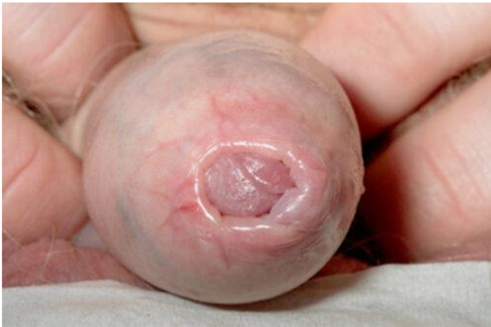
Hình ảnh hẹp bao quy đầu ở trẻ nhỏ