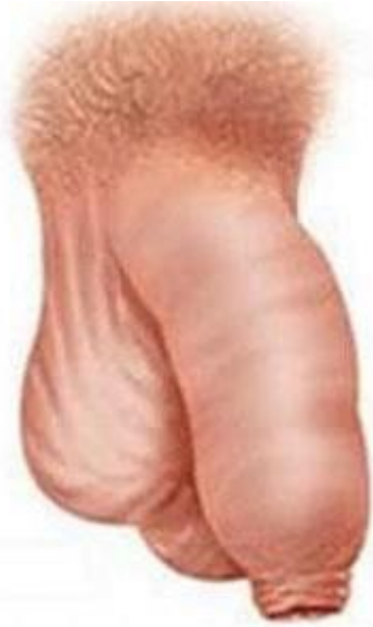
Hẹp bao quy đầu ở người lớn