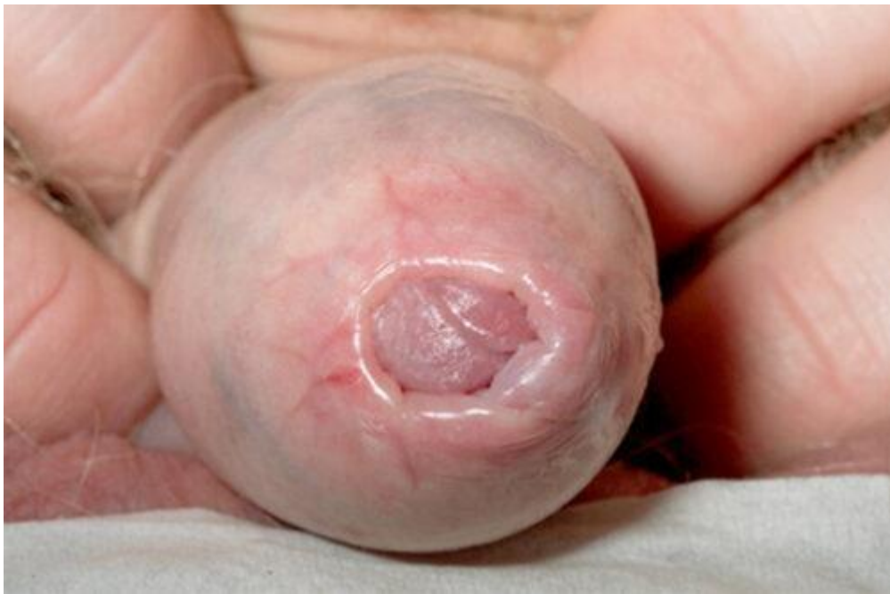
Hình ảnh hẹp bao quy đầu ở trẻ nhỏ