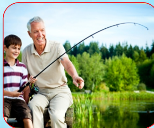
Mắt khỏe mạnh