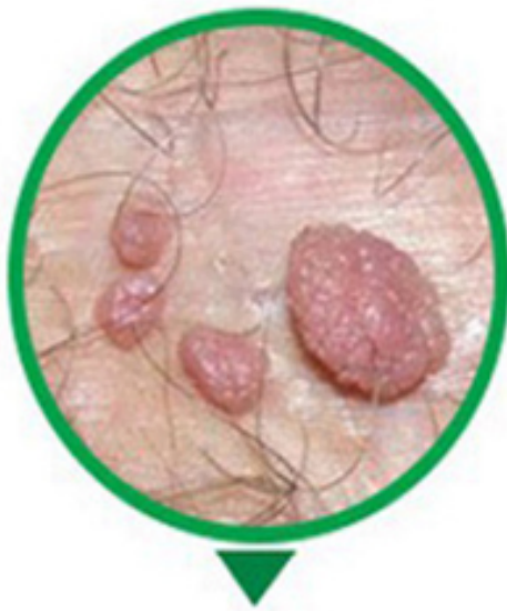
GIAI ĐOẠN 2