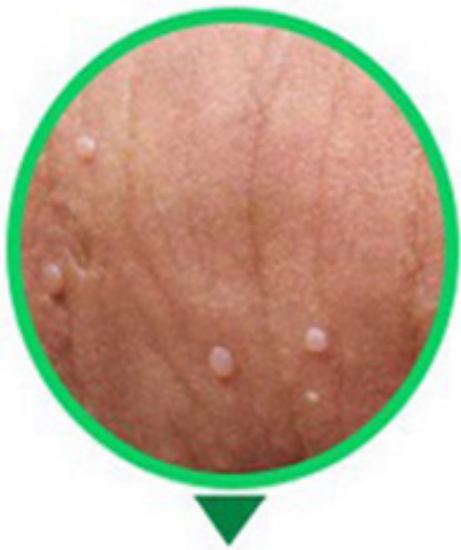
GIAI ĐOẠN 1