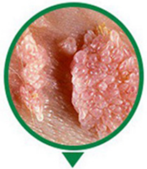
GIAI ĐOẠN 3