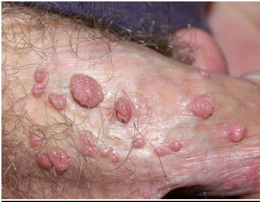
Hình ảnh bệnh sùi mào gà giai đoạn đầu ở nam giới