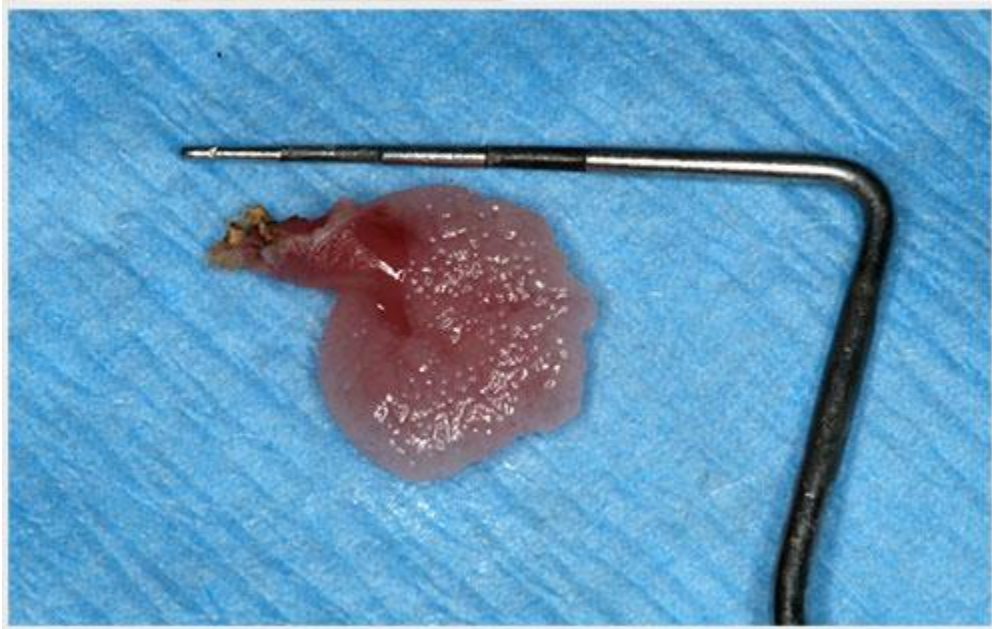
Hình ảnh nốt sỏi mật